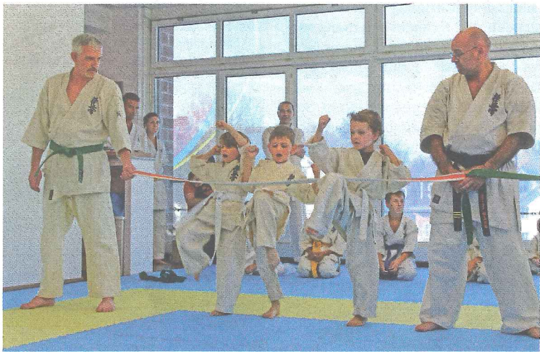
Beinschläge der kleinsten Karatekas.